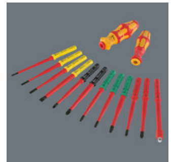
Die 157 mm langen Wechselklingen sind passend für Wera Kraftform Kompakt Griffe mit 9 mm Innensechskant-Aufnahme.