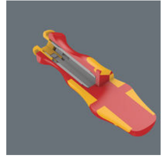
Der Handhalter ist ausschließlich für Wera VDE-Wechselklingen geeignet. Kraftform Plus Griff für angenehm ergonomisches Arbeiten, bei dem Blasen und Schwielen vermieden werden. Harte Griffzonen für hohe Arbeitsgeschwindigkeit, während weiche Griffzonen hohe Drehmomentübertragung garantieren.