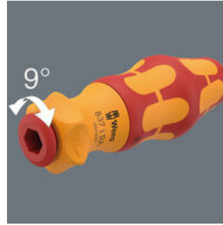
Die integrierte Ratsche mit Feinverzahnung (40 Zähne und ein Rückholwinkel von 9°) vereinfacht und beschleunigt das Schrauben ohne mühsames Neuansetzen.