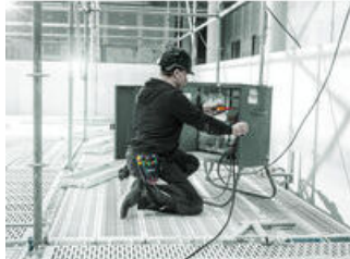
Schraubendrehersätze in Gürteltasche