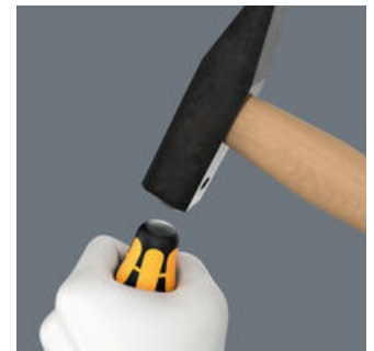
Der Schraubmeißel ist mit einer integrierten Schlagkappe zur Erhöhung der Lebensdauer und Reduzierung der Splittergefahr ausgestattet. Dennoch gilt grundsätzlich: Schutzbrille tragen!

Webink https://www.wera.de/de/05136033001