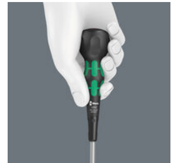
Der ergonomisch geformte Kraftform Ball-Grip liegt hervorragend in der Hand. Seine ballige Form erlaubt die Übertragung hoher Drehmomente bei der Verschraubung.